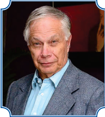
Ph. D. H. C. F. Mansilla

Dedicado con mucho cariño a tres docentes de la Carrera de Filosofía. Nuestra ferviente admiración por la labor docente que desempeñaron y aún desempeñan.